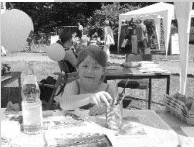
Malwettbewerbe standen bei allen hoch im Kurs.