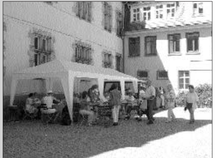
Das Café erfreut sich jedes Mal großer Beliebtheit - besonders, wenn es, wie bei den herrschenden Temperaturen, Schatten bietet.