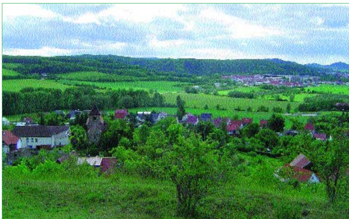
Oberndorf von der „Kevernburg“ aus gesehen (im Hintergrund Arnstadt)