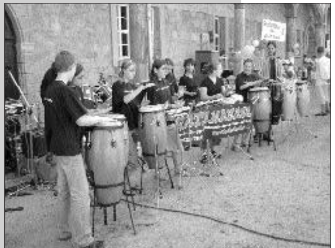
Ein Hoffest ohne die Musikschule ist nicht denkbar. Hier ist es die Percussion-Gruppe "Ratamahata", der Musikschule Arnstadt, die seit langem die Treue hält.