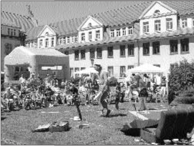
Der Kinderzirkus Tasifan beeindruckte alle durch seine Kunststücke.