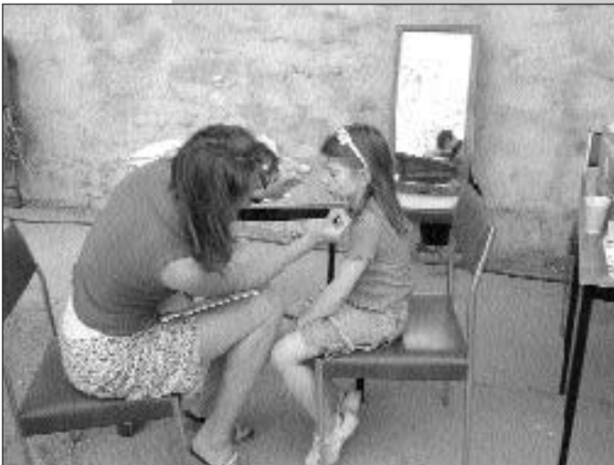
Ohne ein entsprechend geschminktes Gesicht wollte niemand sein.